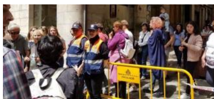
Voluntaris de Protecció Civil al cor del Barri Vell. avpc

Creix el malestar de molts veïns del Barri Vell de Girona per les dificultats que tenen per moure's pels carrers del mateix casc antic per les traves que es troben per Temps de Flors per l'organització de la mostra floral. Sovint han de fer voltes per arribar a casa seva encara que vagin molt carregats i no poden moure els vehicles del seu garatge o els han de deixar aparcats lluny del seu estacionament. Això ha provocat que, per exemple, al carrer de la Força s'estiguin organitzant per expressar la seva queixa a l'Ajuntament. La Força és, de fet, el principal vial dels conflictes, si bé no és l'únic. En paral·lel, l'Associació de Voluntaris de Protecció Civil ha hagut de fer 75 serveis per acompanyar residents a casa seva enmig de la massa de visitants o perquè els veïns afectats poguessin arribar fins al seu domicili anant en contra direcció.