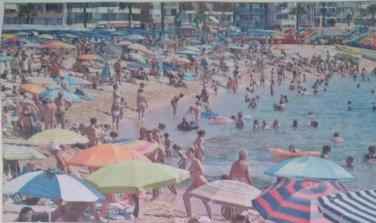
Banyistes a la platja de Lloret de Mar, ahir. MARC MARTÍ